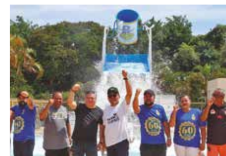
ESPORTE, ANIVERSÁRIO, LAZER - Temporada foi intensa. Futebol todo domingo. Aniversário de 61 anos do Sindicato, dia 30 de abril. Inauguração do Big Balde no Clube de Campo.