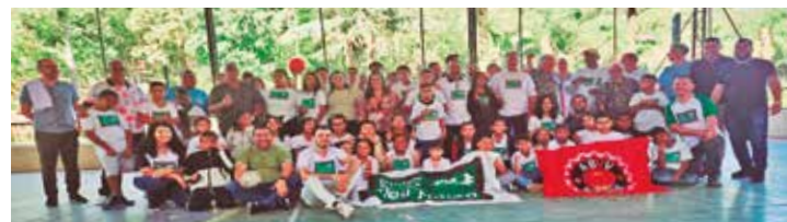
ALEGRIA - Delegação belga, diretores do Sindicato e educandos

Notebooks - Eles doaram nove computadores