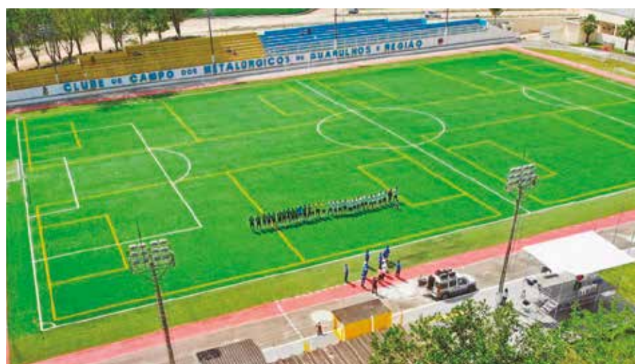
TAPETE - Reformas, manutenção e melhorias deixam campo um tapete