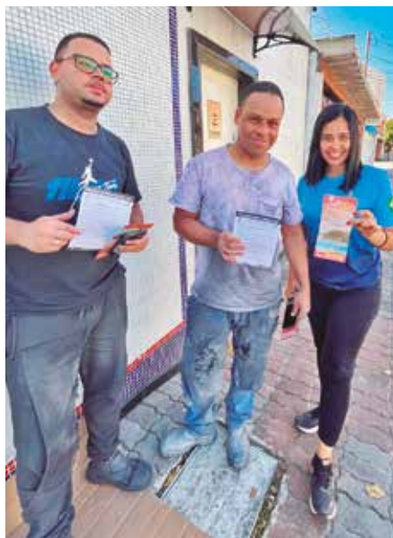
ROSSINI - Mais dois associados

Colégio Torricelli - Concedeu bolsas pra Jovens e Adultos - referentes ao primeiro ciclo do Fundamental.