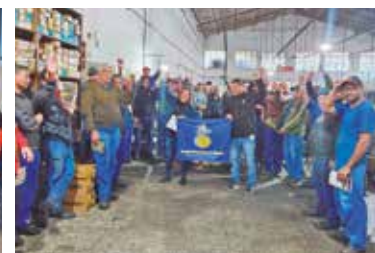
GRUPO BTM, VALLOUREC E RENOPAR - Acordos de PLR melhoram renda dos funcionários