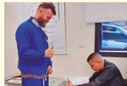
VOTAÇÃO PRA DELEGADO Na Rossetti e também na Golin

O delegado sindical dá o primeiro sinal sobre alguma demanda pendente, avisando o Sindicato. O representante precisa ser comunicativo e saber dialogar com seus colegas de trabalho.