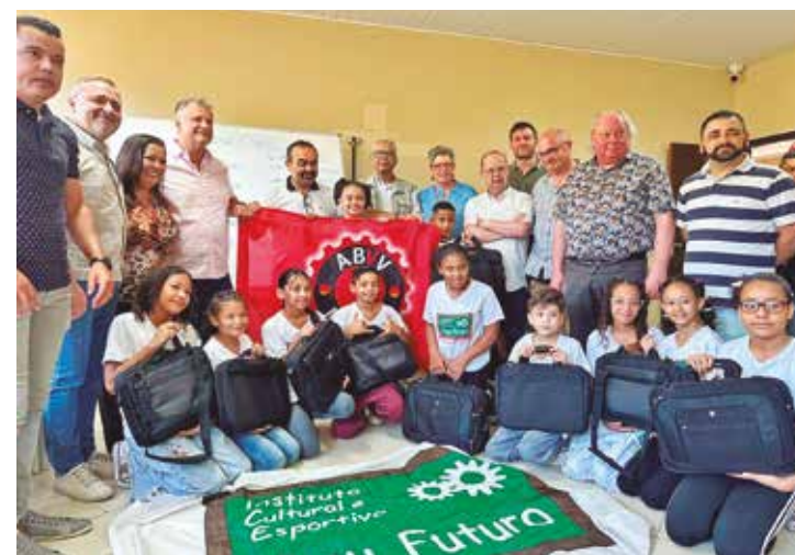
DOAÇÃO - Reciprocidade. Alegria por doar, alegria por receber