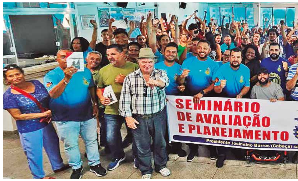
SEMINÁRIO - Categoria se reúne na sede, dia 18 de maio. Em debate: organ

Encontro de Mulheres - Departamento Feminino realizou Encontro, dia 14, na sede. Tema: “Mulheres Metalúrgicas juntas contra a violência”. Grande participação de metalúrgicas!